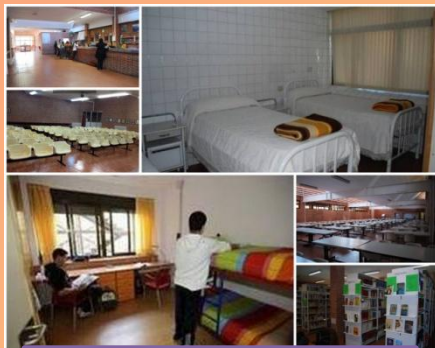
Enfermería, Residencia, Biblioteca, Cafetería, Comedor, Aula Magna