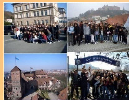
Programa Lingüístico de Inglés