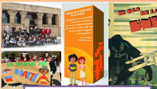
Actividades solidarias, viajes, revista