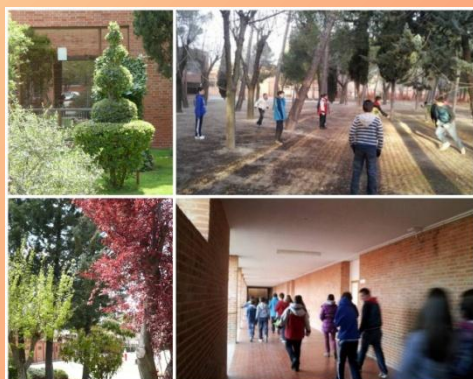
Jardines, Aulas y Patio 1er ciclo ESO